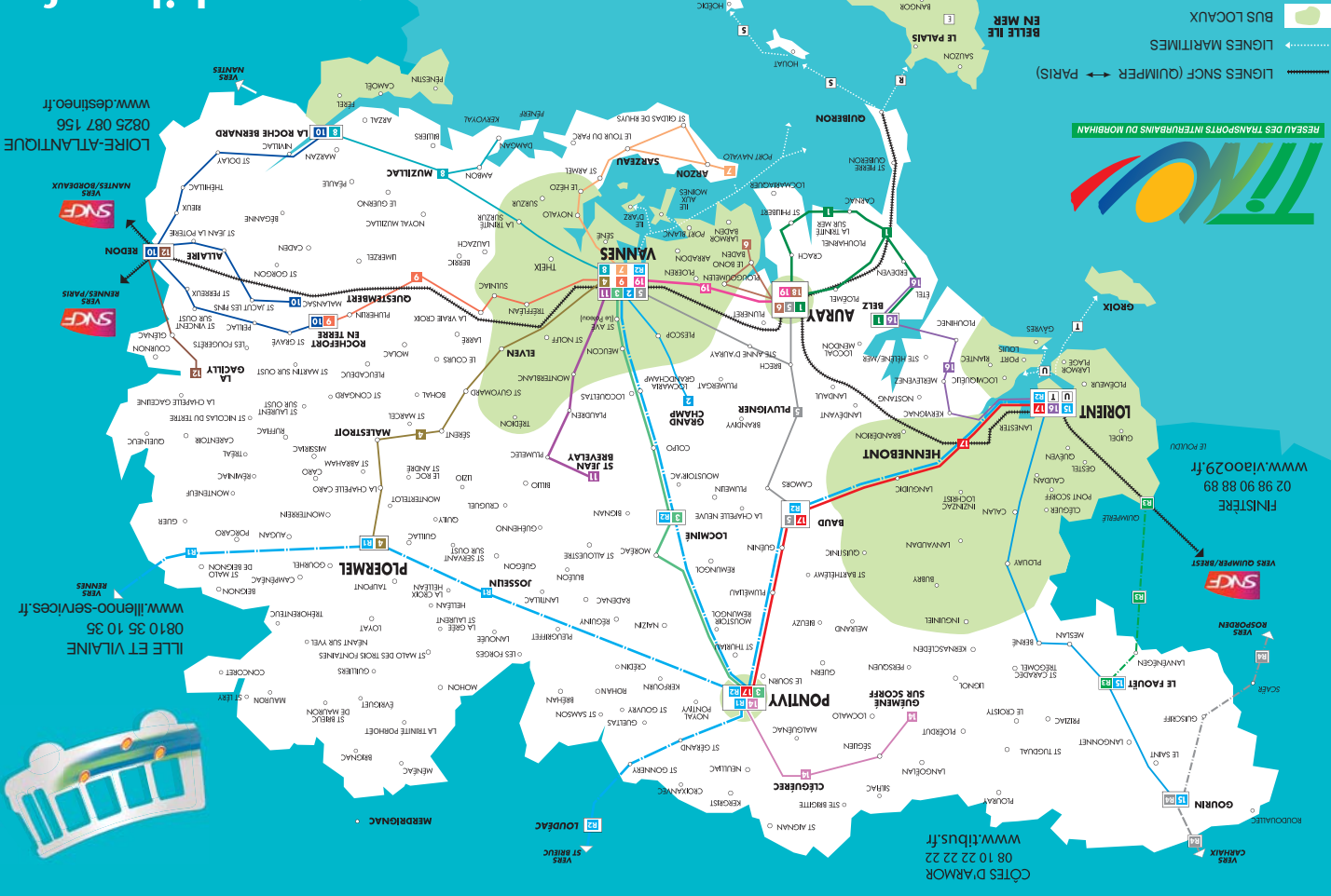
Plan des transports publics du Morbihan